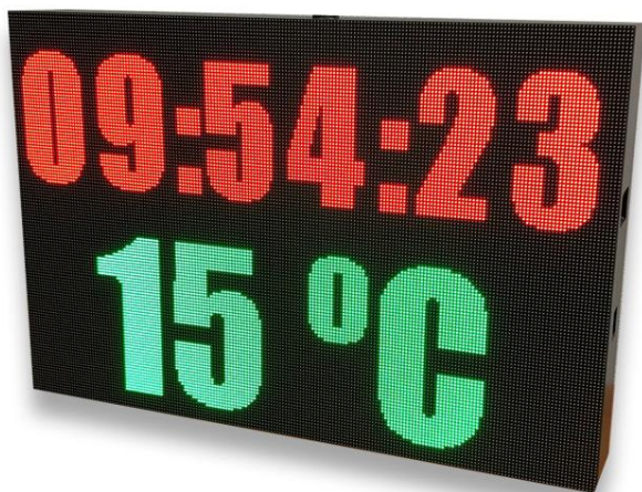
Módulo Full-Color Exterior

Esta familia de pantallas son el complemento publicitario perfecto en cualquier tipo de negocio. El alto brillo, sus juegos de animaciones o la posibilidad de conjugar textos, vídeos e imágenes en una misma pantalla hacen que nuestros clientes localicen y se informen de los servicios que presta nuestro negocio de forma rápida y eficaz. Gracias a la versatilidad de los módulos podremos crear una pantalla que se adapte a nuestras necesidades.