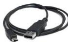
Cable mini USB