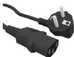
Cable de red