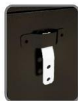
Detalle del anclaje