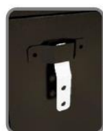
Detalle del anclaje