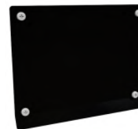
Tapa de conexiones