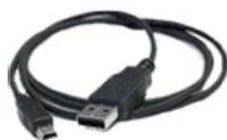
Cable mini USB